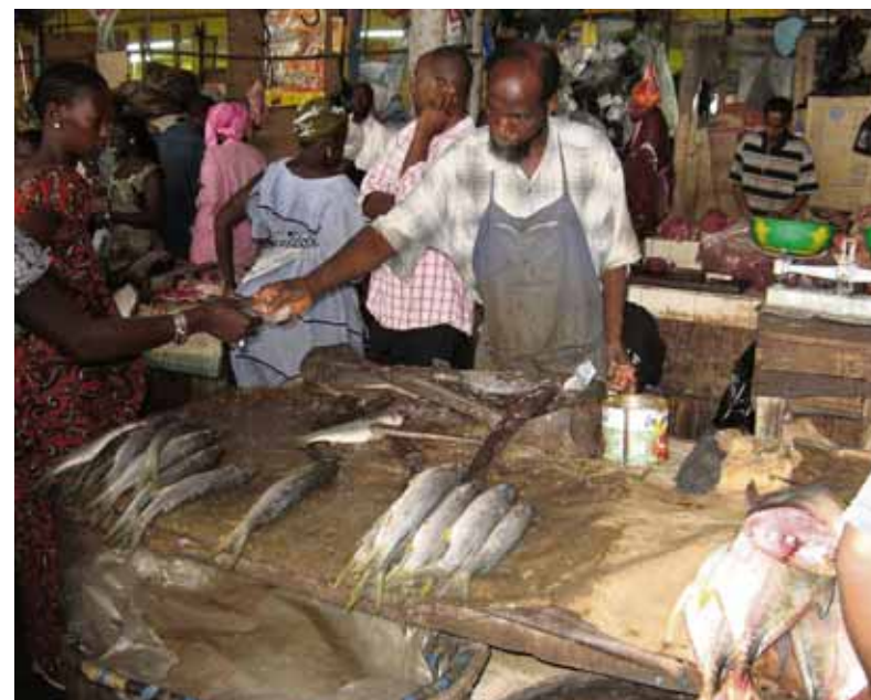
Yfirþyrmandi Ímyndið ykkur að standa á þessum stað á Marché de Tilène í Dakar. Hitinn á markaðnum var kæfandi og lyktin af fiskinum og kjötinu fyrir aftan stæk. En flugurnar voru í essinu sínu.

Malí er landlukt ríki og þar er áttunda hæsta dánartíðni hvítvoðunga í heiminum (að meðaltali deyja 107,58 börn af hverjum þúsund. Samsvarendi tala á Íslandi er 3,29). Innan við 4% landsins er hæft til ræktunar; annað er óravíðátta Sahara-eyðimerkurinnar. Fleiri ferðamenn fara þó til Malí en annarra ríkja í Vestur-Afríku enda eru þar nokkrir staðir á heimsminjaskrá UNESCO, þar á meðal Dogon-héraðið, hin goðsagnakennda Timbúktú og moskan í Djenné, sú stærsta í heiminum sem gerð er úr leir. Ófriðlegt hefur verið í héruðum Túarega norður af Timbúktú en annars á ferðamönnum að vera óhætt að ferðast um Malí eins og þá lystir.