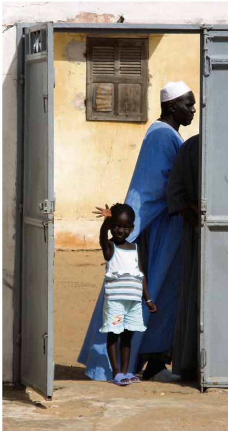
Halló Kaftanar í skærum litum eru hefðbundinn klænaður í Senegal og þægilegir í rakanum. Einnig er nánast hefð að næsta barn hlaupi til og stilli sér ófeimið upp sjáist myndavél á lofti.