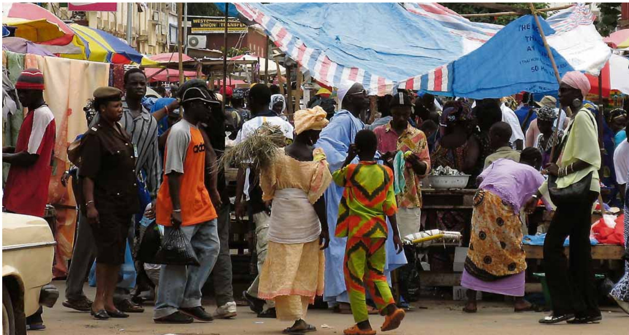
Mannþróng Aðalmarkaðurinn í Banjul er alltaf iðandi af fólki að kaupa og selja allt frá ferskum ávöxtum og pottum og pönnum til þjófstoðinnar tónlistar og ilmvatns.