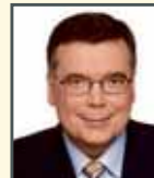
Geir H. Haarde