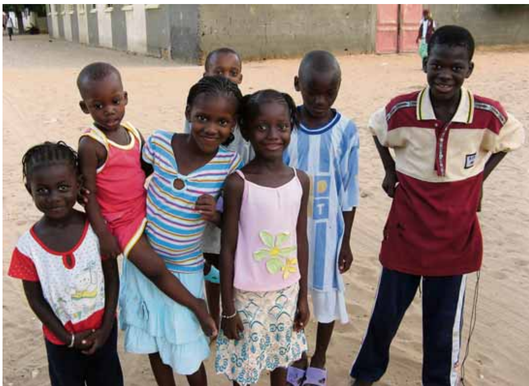
Líf og fjór Börn umkringja gesti hvar sem þeir koma, einkum í þorpum. Þessir krakkar eru í stórfjölskyldu fólksins, sem ég bjó hjá í norðurhluta Senegal. Þeir umkringdu mig og vildu ólmir komast á mynd.

Svona mætti helst lýsa fyrstu nóttinni minni á Auberge Toguna í Bamako, hóteli þar sem gistingin kostaði 12.000 CFA á nótt (1.500 krónur) og flokkaðist því undir „ódyrt“ í ferðahandbókunum. Moskítóflugurnar eru sérlega varhugaverðar að næturlagi því bíti þær í svefni er hætta á malaríusmiti án þess að maður geri sér grein fyrir því og sjúkdómurinn getur dregið fólk til dauða sé ekki gripið til rétttra ráða í tæka tíð. Og rafmagn fer oft af hverfum eða gervillum borgum