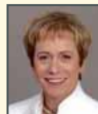
Ingibjörg Sólrún Gísladóttir