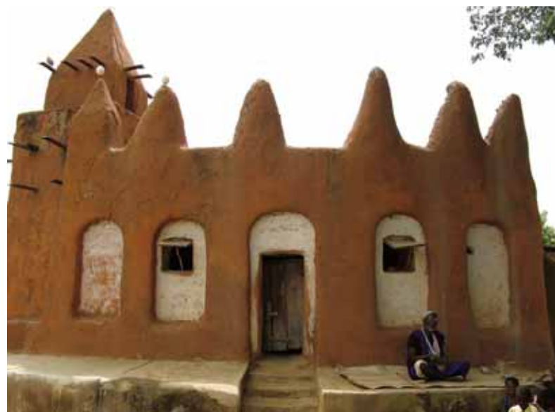
Hefðin Þessi leirmoska er dæmigerð fyrir svæðið. Hún er ein af þremur moskum í smáþorpinu Ségoukoro, sem er um 10 kílómetra frá Segou. Konungur Bambara stjórnuðu frá þorpinu á 18. öld.