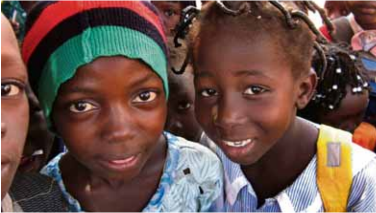
Tilbúin fyrir nærmynd Tveir nemendur stilla sér upp í frímínúttum. Stúlk- an til vinstri er með hárgreiðslu, sem er vinsæl hjá stúlkubörnum.