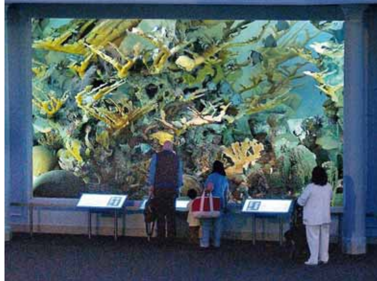
Heillandi safn Hér er hægt að skoða lífríki þriðja stærsta kóralrífs heims við eyjuna Andros í karabíska hafinu á Náttúrusögusafninu í New York.