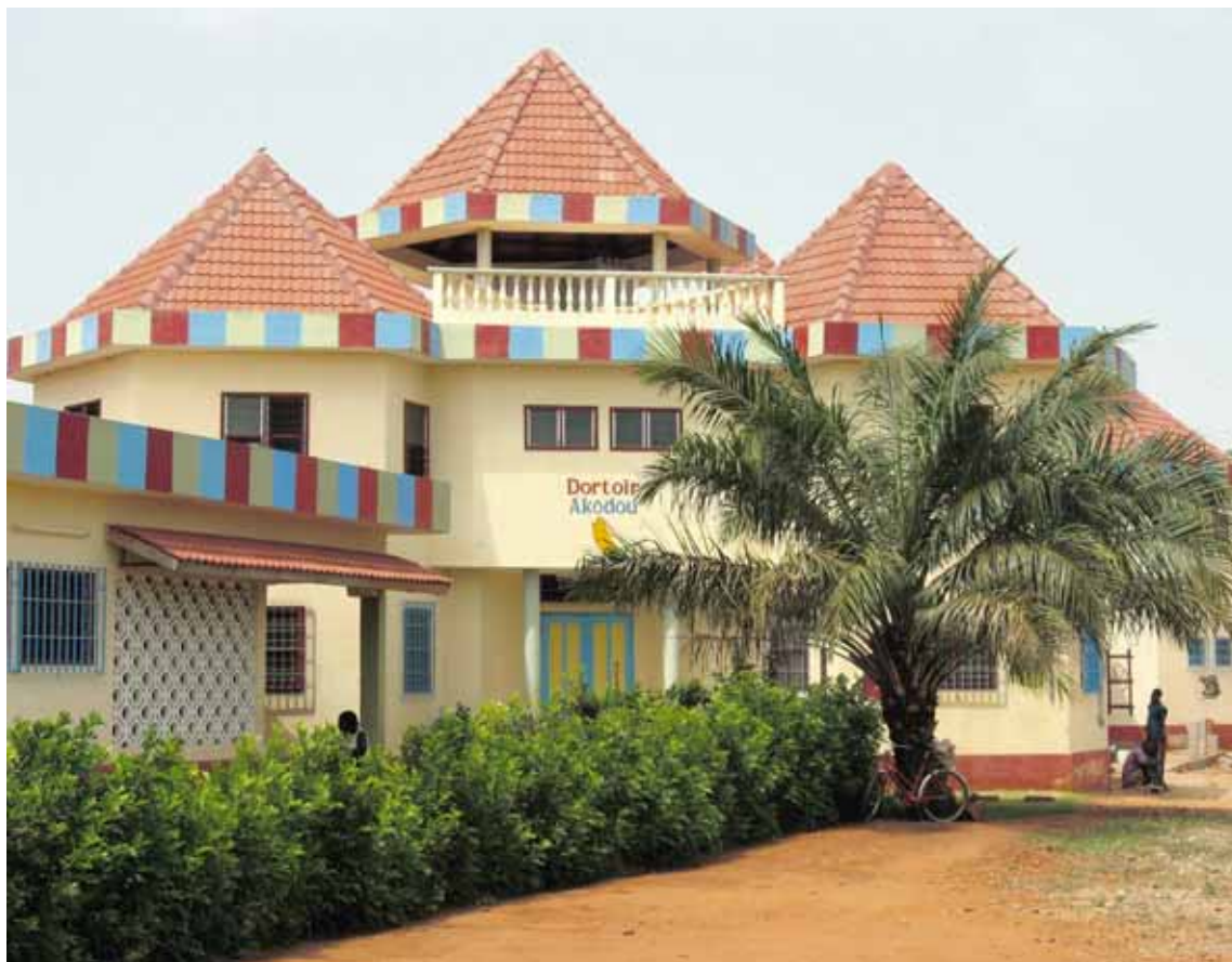
Ævintýrin gerast enn Aðalbygging Spes í Lomé er líkust ævintýrakastala. Öll byggingin er máluð skærum litum, að innan sem utan.

stjórnvalda og annarra vildarvina fyrir stuðning við hælið. Í portinu hljóp einn fjörkálfurinn um í stutt-ermabol með merki Sparisjóðsins.