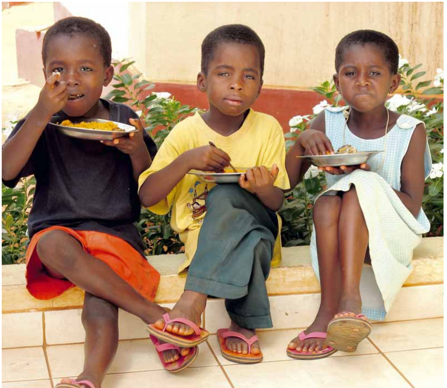
Hádegismatur! Börnin í munaðarleysingjahæli Spes í Lomé gæða sér á heitum málsverði í hádeginu. Stúlkan borðar með hægri hönd eins og er til siðs á þessum slóðum; þá vinstri má hins vegar ekki nota til þess arna samkvæmt venju og hefð.

Á einum veggnum var málverk af ávaxtakörfu og þar fyrir ofan látlaus skjöldur með þökkum til íslenskra